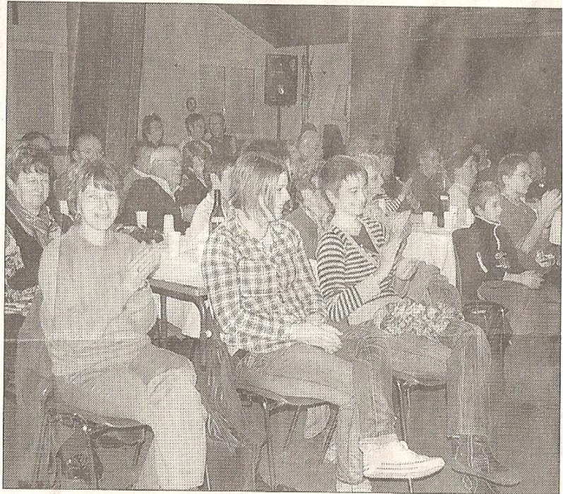
■ Un public conquis par ce genre de spectacle.

Les nombreux spectateurs avaient un moment d'hésitation en entrant, car la salle était disposée comme pour un mariage. Le public était réparti autour de tables couvertes de nappes blanches et sur lesquelles reposaient déjà verres et bouteilles. Ils devenaient ainsi pour deux heures, les invités à la noce. Douze comédiens talentueux, parmi lesquels figurait un « enfant du pays » ont fait revivre un mariage des années 50, avec de nombreux tableaux, la séance photos, le repas, la danse, au cours desquels chacun règle ses comptes, le père avec le fils, la mère avec son mari ;