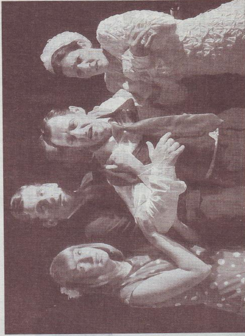
■ Le mariage réussi de comédiens amateurs et professionnels.